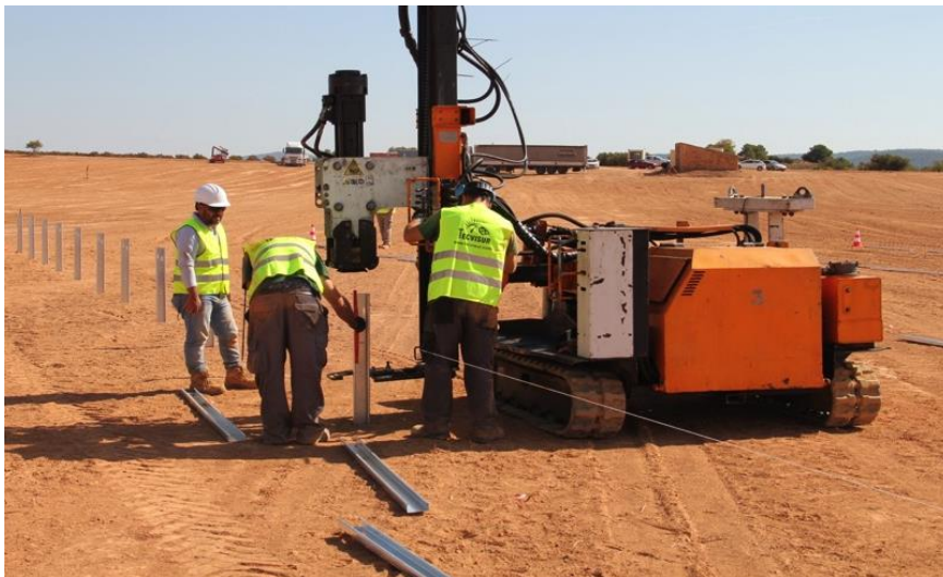
Die Unterkonstruktion wird in den Boden gerammt, Aufnahme vom 17.10.2017

Modulproduktion. Zudem beeinflusste der amerikanische Markt die Modulverfügbarkeit negativ. Dies, weil in den USA eine Klage hängig ist, mit welcher höhere Zölle wegen angeblichen chinesischen Dumpingpreisen gefordert werden. Da so massiv höhere Modulpreise im Raum stehen, deckte sich offenbar «ganz USA» mit Modulen ein.