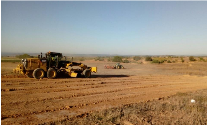
Vorbereitungsarbeiten: Planierung des 30 Hektar Grundstücks