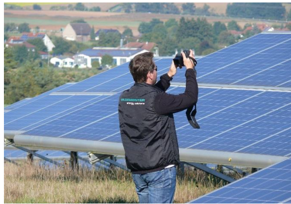
Wartung von Photovoltaik-Anlagen

Im Laufe der mittlerweile dreijährigen Zusammenarbeit mit Gildemeister hat Edisun Power neben dem fairen Preis für Dienstleistungen vor allem die Flexibilität und das vorhandene Know-how zu schätzen gelernt.